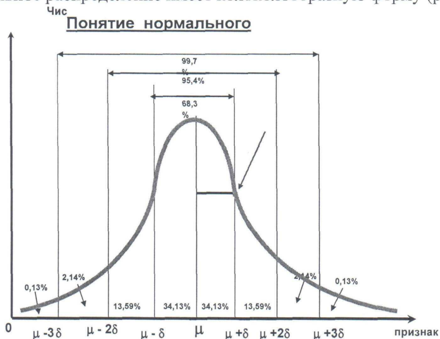
Рис. Кривая нормального распределения К.Гаусса

Нормальное распределение имеет колоколообразную форму (рис. 1).